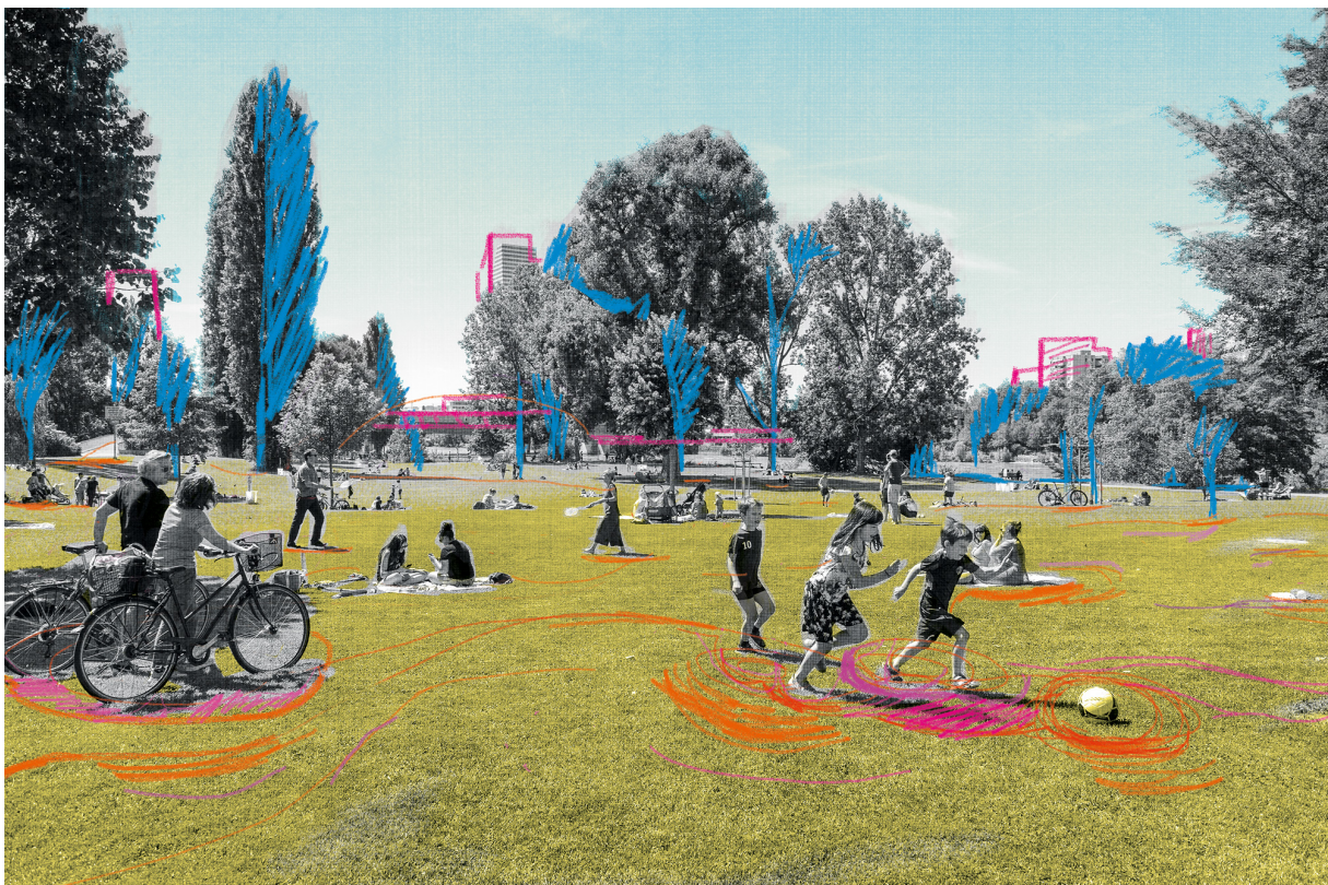
Tema centrale DIGITALIZZAZIONE