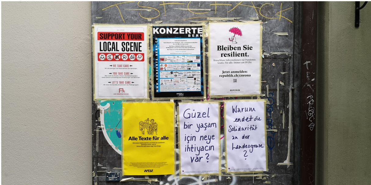
Tema centrale SVIZZERA COMUNITARIA