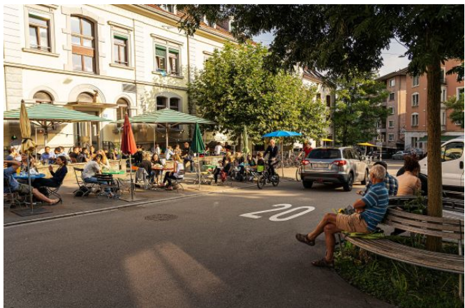
Tema centrale ECOLOGIA E SPAZI APERTI © Città di Winterthur (Foto: EBP) e Zurigo